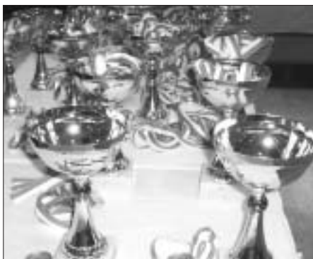
Minden díj gazdára lelt

I smét eltelt egy üzemi bajnoki szezon. Nem a könnyebbek közül való, amit a Postás-Matáv SE maga mögött hagyott. A legfőbb feladata a fenntartó vállalatok elvárása alapján a dolgozók rekreációjának segítése. Ennek változatlanul sikerült megfelelnie. A kiterjedt szabadidős versenysportrendszer életképességének ékes bizonyítéka a bajnokságok zárultával megtartott hagyományos díjkiosztó ünnepség.